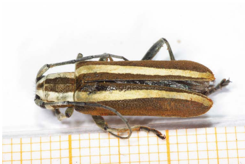
Abb. 2: Belegexemplar von Saperda candida (Dorsalansicht) von Fehmarn (Oliver Nolte, 2008)