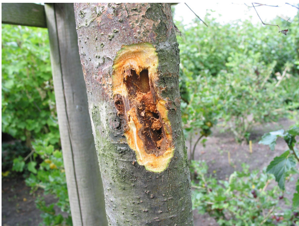
Abb. 10: Befall durch Saperda candida am Stamm eines Apfelbaumes auf Fehmarn nach dem Anschneiden (PETER BAUFELD, 2008)