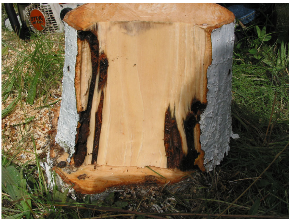
Abb. 12: Fraßgänge, verursacht durch Saperda candida in einer Schwedischen Mehlbeere auf Fehmarn (PETER BAUFELD, 2008)