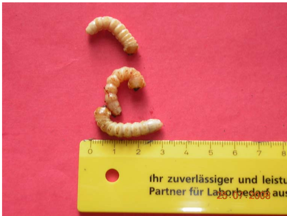
Abb. 5: Larven von Saperda candida aus der befallenen Schwedischen Mehlbeere auf Fehmarn (JENS MATTHEY, 2008)