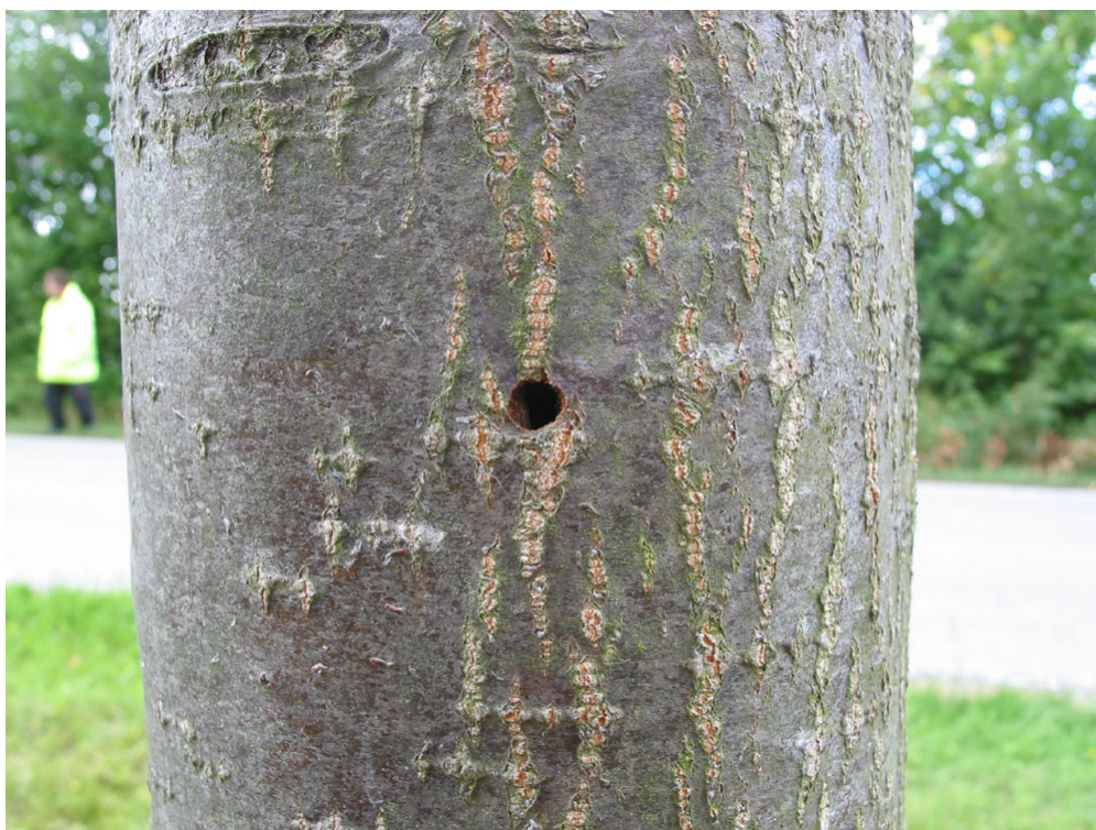
Abb. 8: Ausbohrlöcher von Saperda candida treten aber auch im gesamten Stammbereich auf (PETER BAUFELD, 2008)