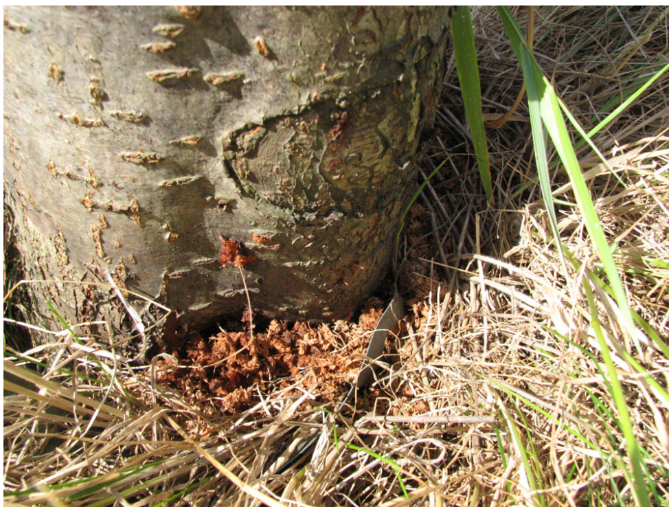
Abb. 9: Genagsel von Saperda candida am Stammgrund einer Schwedischen Mehlbeere auf Fehmarn (MARTINA ADAMO, 2008)