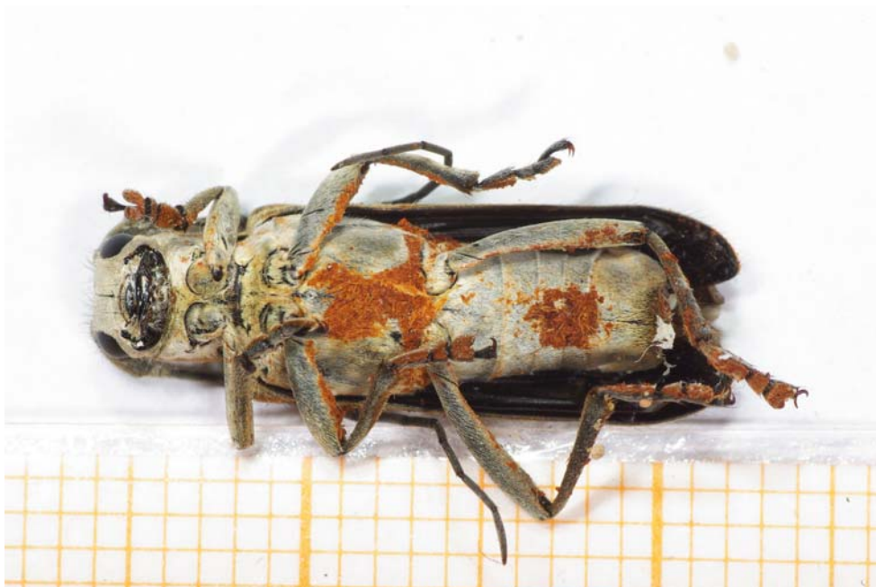
Abb. 3: Belegexemplar von Saperda candida (Ventralansicht) von Fehmarn (OLIVER NOLTE, 2008)