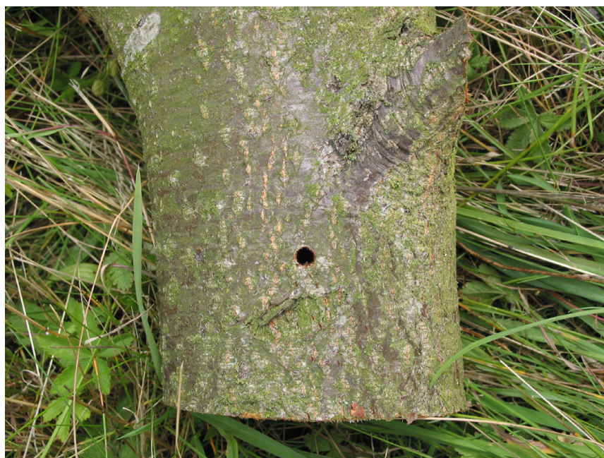
Abb. 6: Frisches Ausbohrloch von Saperda candida an einer Schwedischen Mehlbeere auf Fehmarn (PETER BAUFELD, 2008)