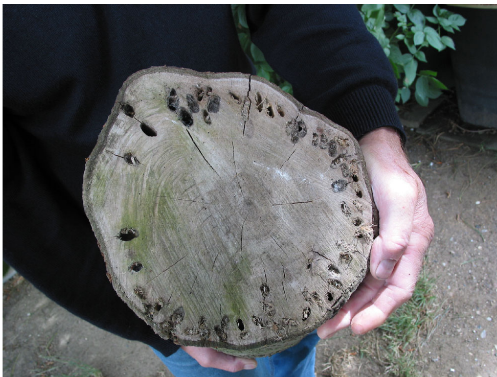
Abb. 11: Massiver Befall durch Saperda candida in einer Schwedischen Mehlbeere auf Fehmarn