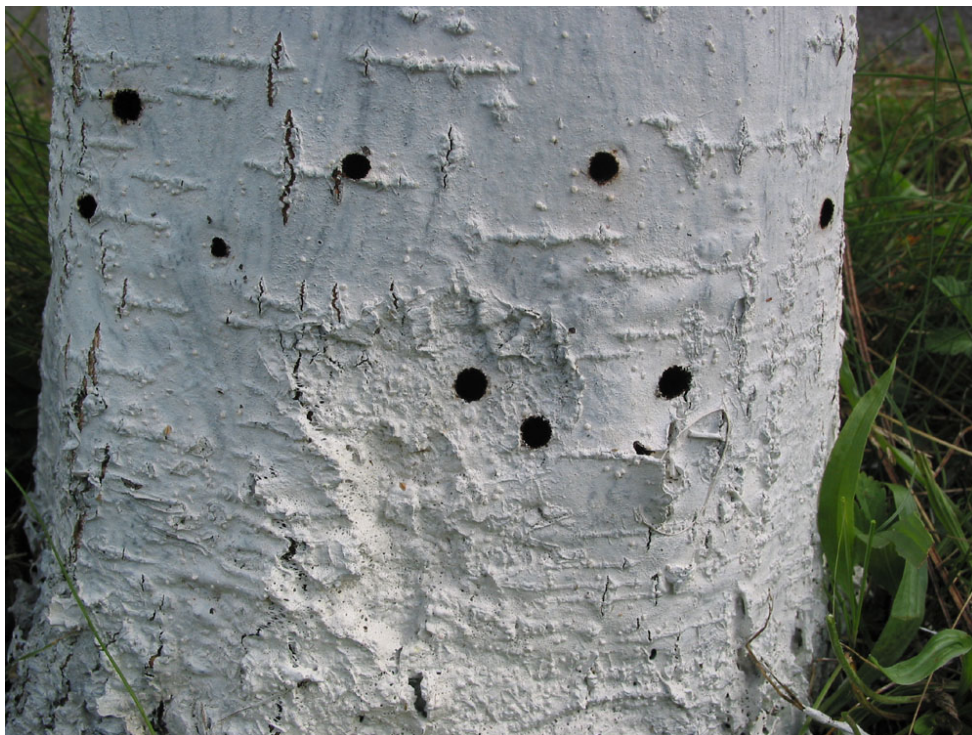
Abb. 7: Ausbohrlöcher von Saperda candida sind vorwiegend an der Stammbasis zu finden (PETER BAUFELD, 2008)