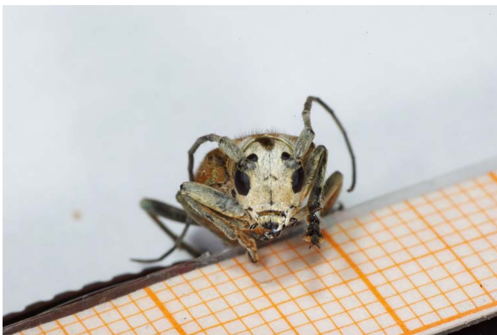
Abb. 4: Belegexemplar von Saperda candida (Frontalansicht) von Fehmarn (OLIVER NOLTE, 2008)