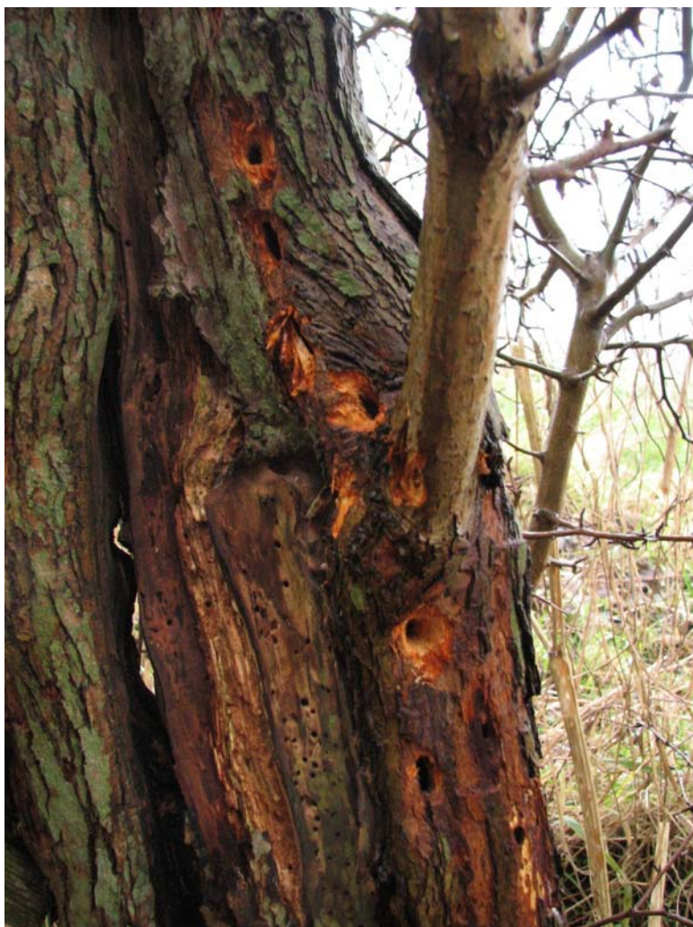
Abb. 13: Spechte nutzen die Larven von Saperda candida in Weißdorn als Nahrung (MARTINA ADAMO, 2009)